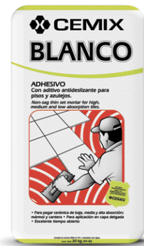
Presentación: Saco de 20kg.